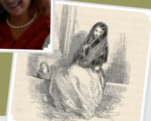
Grabado de L. Tenison.